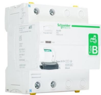
Voorbeeld Aardlekschakelaar Type B 16 ampère / 30 milliampère