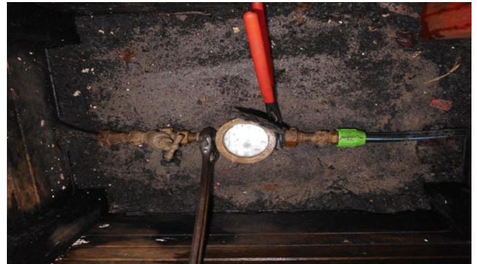
Bahco (links) en waterpomptang (rechts)