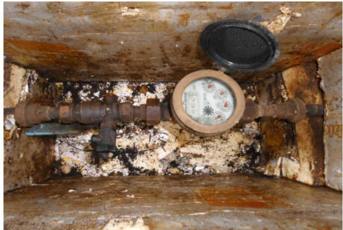
Watermeter in een geïsoleerde put.